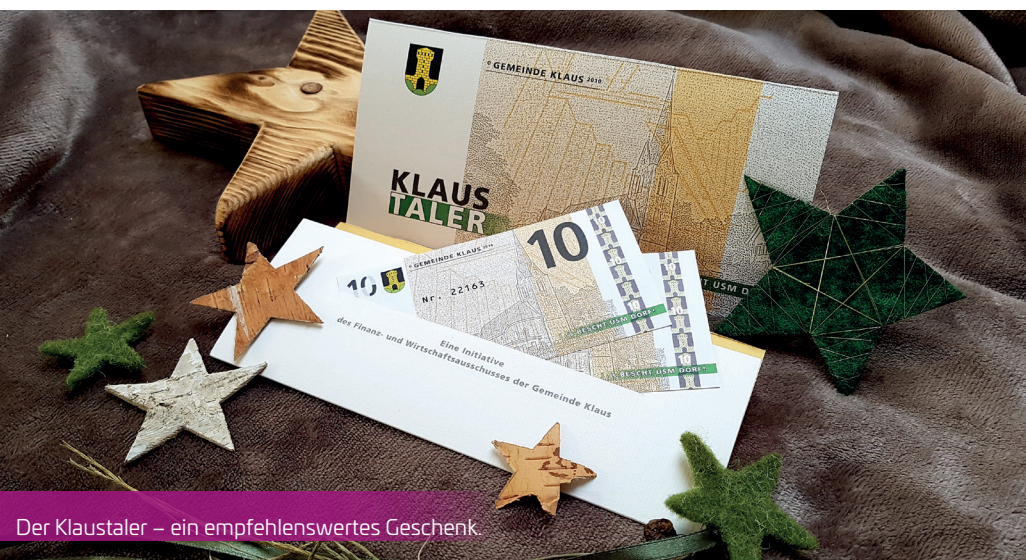
Der Klaustaler – ein empfehlenswertes Geschenk.